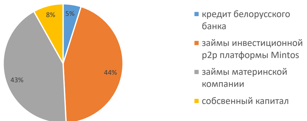
Структура фондирования лизингового портфеля